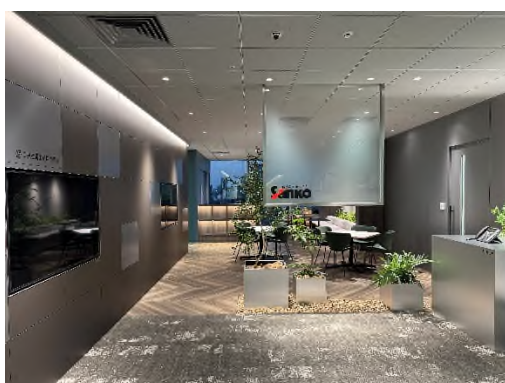
（写真左／エントランス）