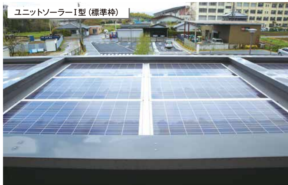
南部福祉センター 奈良県