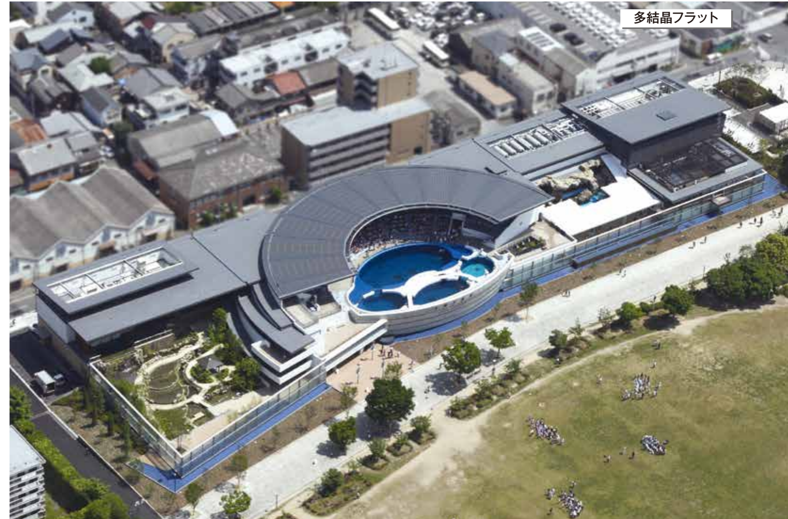
京都水族館 京都府