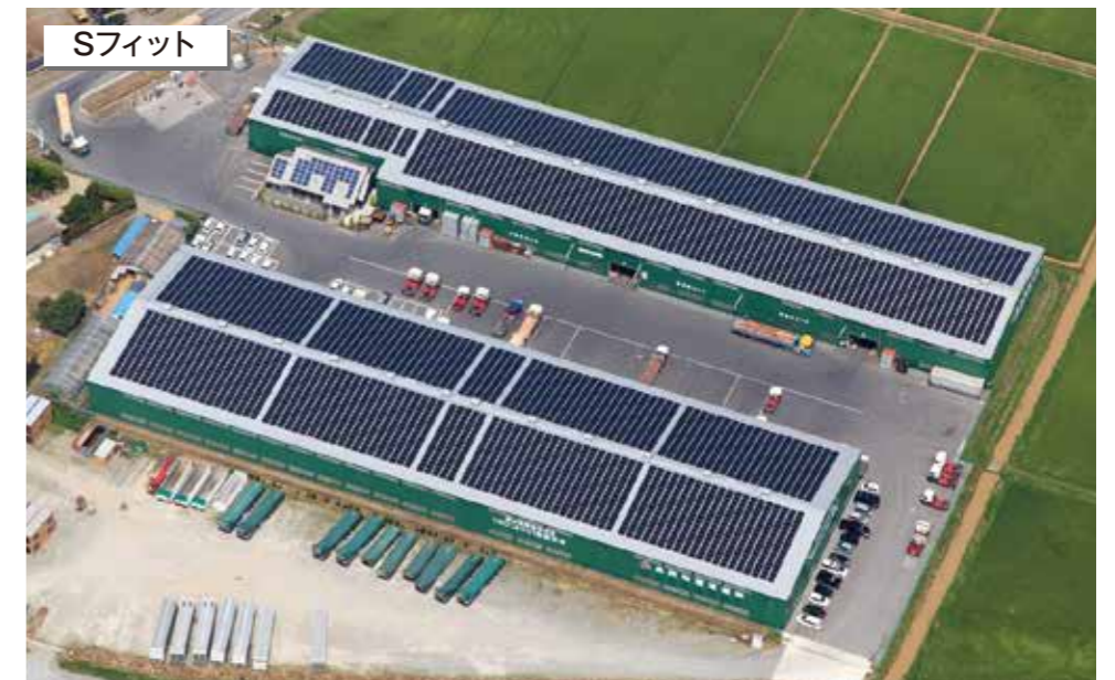
奥洲物産運輸(株) 宮城県