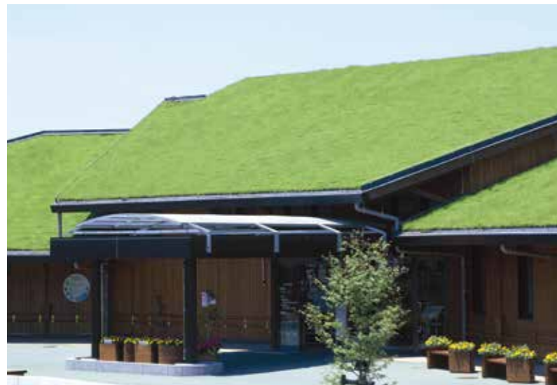
静岡県立森林公園ビジターセンターバードピア浜北 静岡県