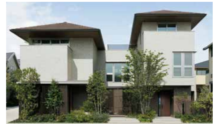
提供：ミサワホーム GENIUS UD