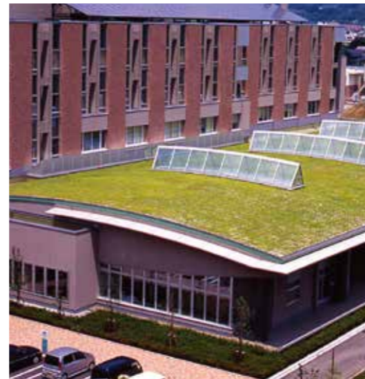
岩手県立二戸病院 岩手県