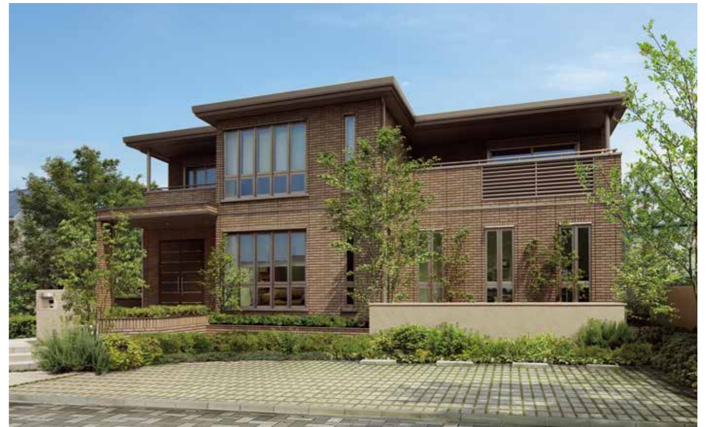
提供：積水化学工業 セキスイハイム パルフェ